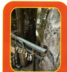
太郎坊宮御神前(ごしんぜん)にそびえる 鳥居・夫婦岩(めづまいわ) その原石を込めた特別のお守りです 太郎坊宮 滋賀県東近江市